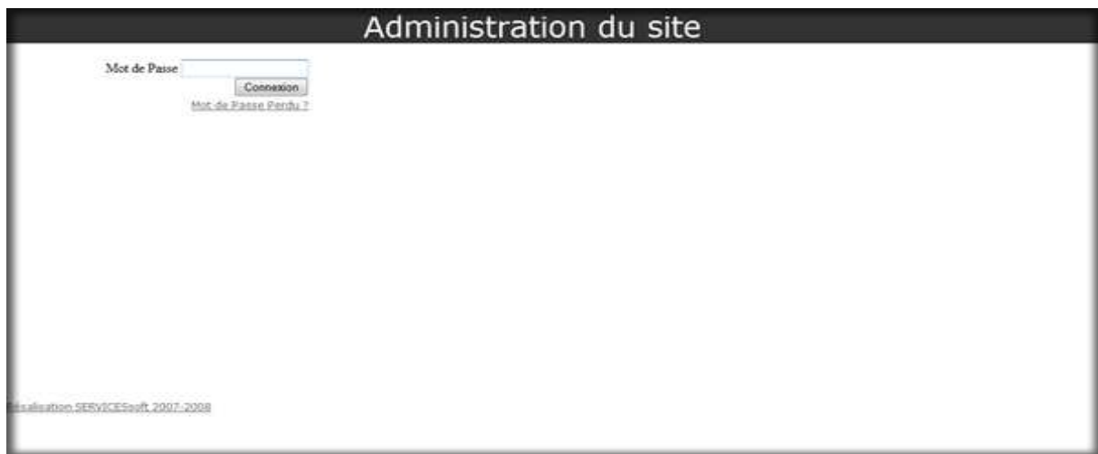
Figure A.1 : Masque de saisie «Authentification »