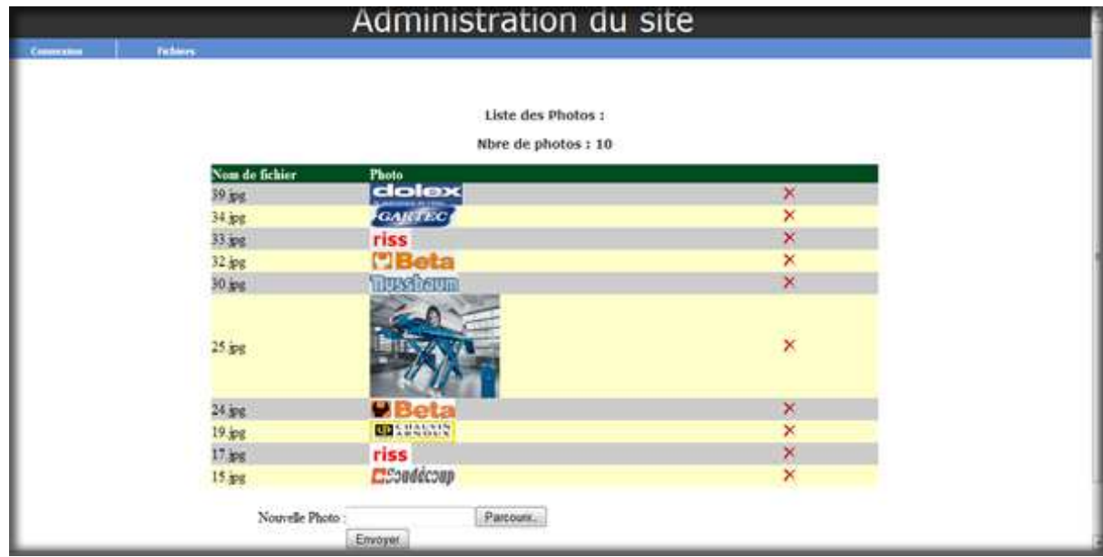
Figure A.4 : Masque de saisie «Photos »